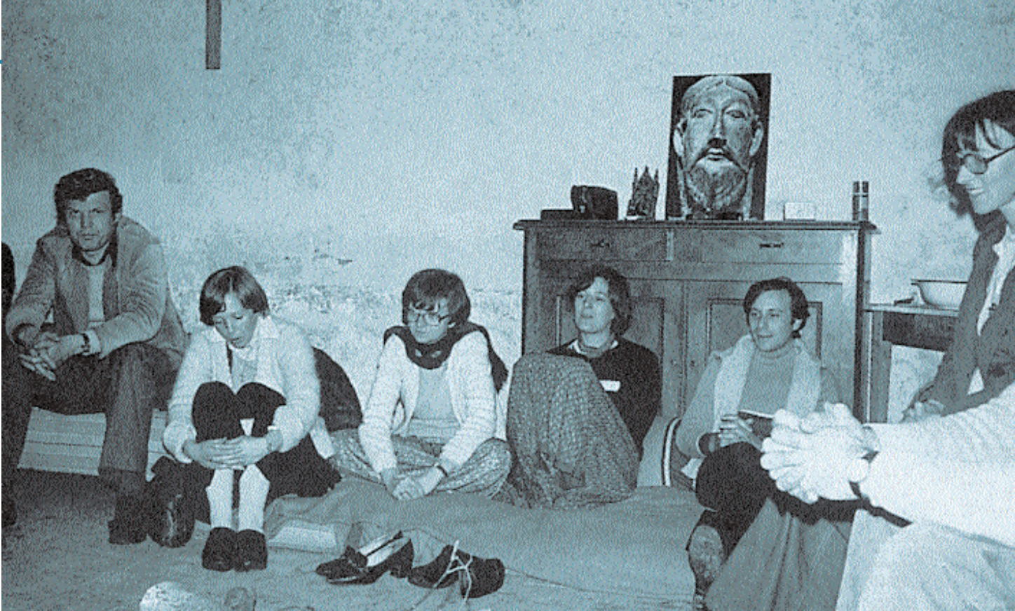
Un des premiers groupes de prière de l'Emmanuel.

sonnes. Un an après, elles sont cinq cents ! Il faut déménager plusieurs fois et fonder deux autres groupes de prière à Paris. Dans ces assemblées de prière, des merveilles se produisent et la vie de très nombreuses personnes est transformée. Le nom d'«Emmanuel» est alors reçu de Dieu pour désigner cette réalité en fondation.