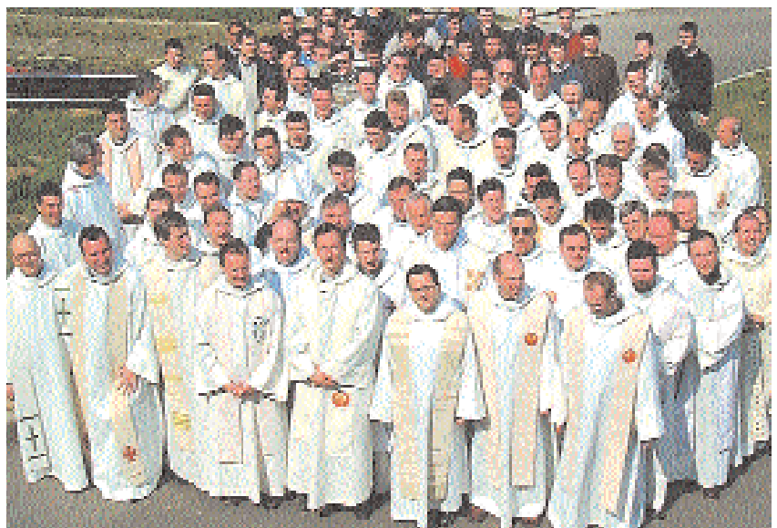
Des prêtres heureux de vivre leur mission avec des laïcs.

son être et son ministère, est une attitude d'émerveillement et un regard d'espérance posé sur l'œuvre de Dieu dans le monde et dans l'Église. Il est un adorateur du Père. Il passe de longs moments devant le Saint Sacrement, en présence de Jésus Eucharistie pour demander un cœur semblable au sien : «Je vous donnerai des pasteurs selon mon cœur...» Sa vocation, sa vie et sa prédication, sont liées à la spiritualité du Cœur de Jésus. Ce cœur qui a tant aimé les